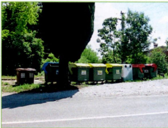
ekološki otok Komen