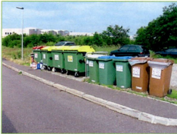
ekološki otok Kozina