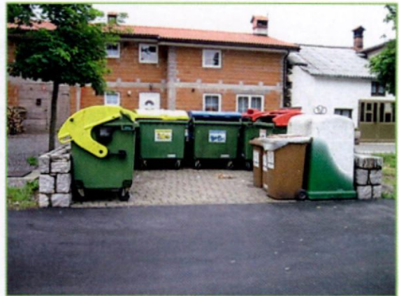
ekološki otok Senožeče