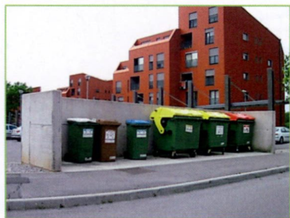
ekološki otok Sežana

Na ekoloških otokih je postavljenih minimalno 6 zabojnikov za ločeno zbiranje papirja, plastenk, plastične embalaže, steklene embalaže, pločevink in bio odpadkov. Zabojniki se praznijo najmanj 1x tedensko, nekateri kraji pa tudi 2x tedensko.