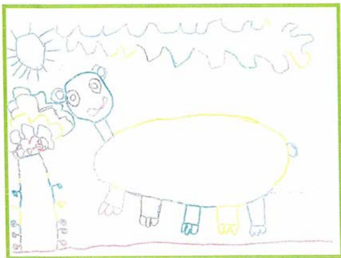
Zoja, 5 let