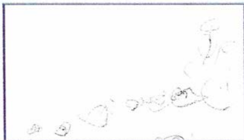
Žan, 3 leta

Pomočnice ravnateljice in ravnateljica so z lastnim iskanjem dobrih, sodobnih pedagoških rešitev, s svetovanjem strokovnim delavcem, pogovori, zagotavljale pogoje za kvalitetno delo oz. bivanje in sobivanje vseh, ki so vpeti v vrtec.