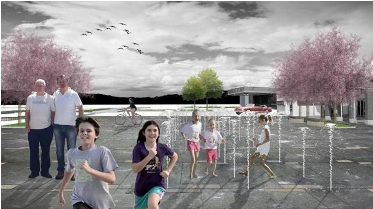
Slika 2: Prikaz predvidene ureditve