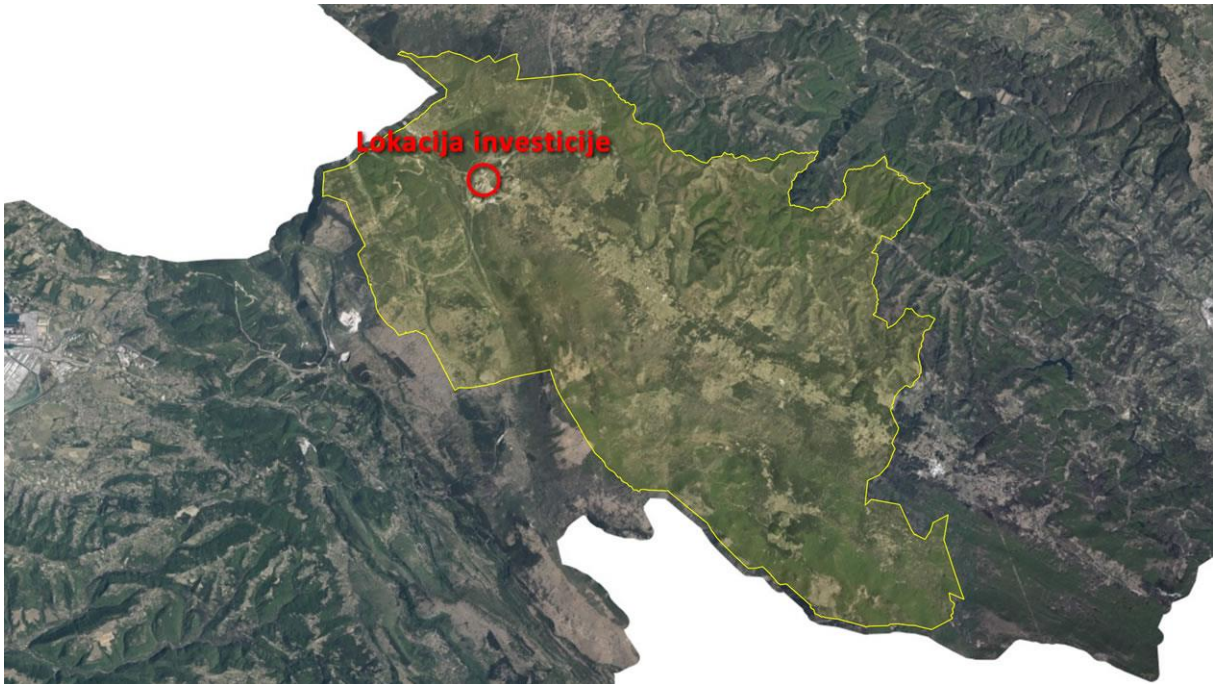
Slika 3: Območje občine Hrpelje - Kozina in lokacija investicije