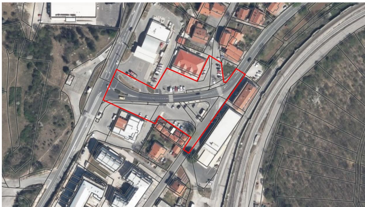
Slika 5: Prikaz investicije na ortofoto posnetku